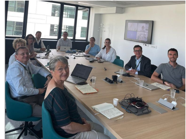
Jury du premier AMI IA & Maladies Rares du CSF ITS - IA & Santé

Objectif : Générer des projets avec un impact opérationnel concret et rapide sur le terrain.